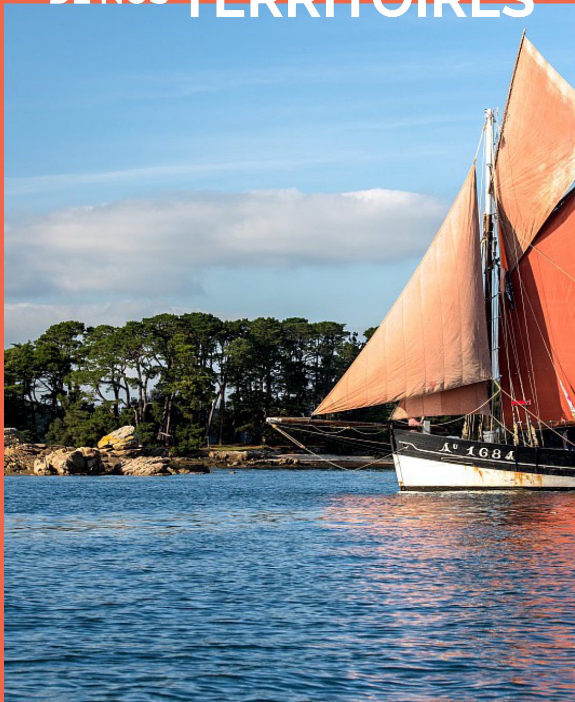
Bateau Sinagot à Ronan - Morbihan