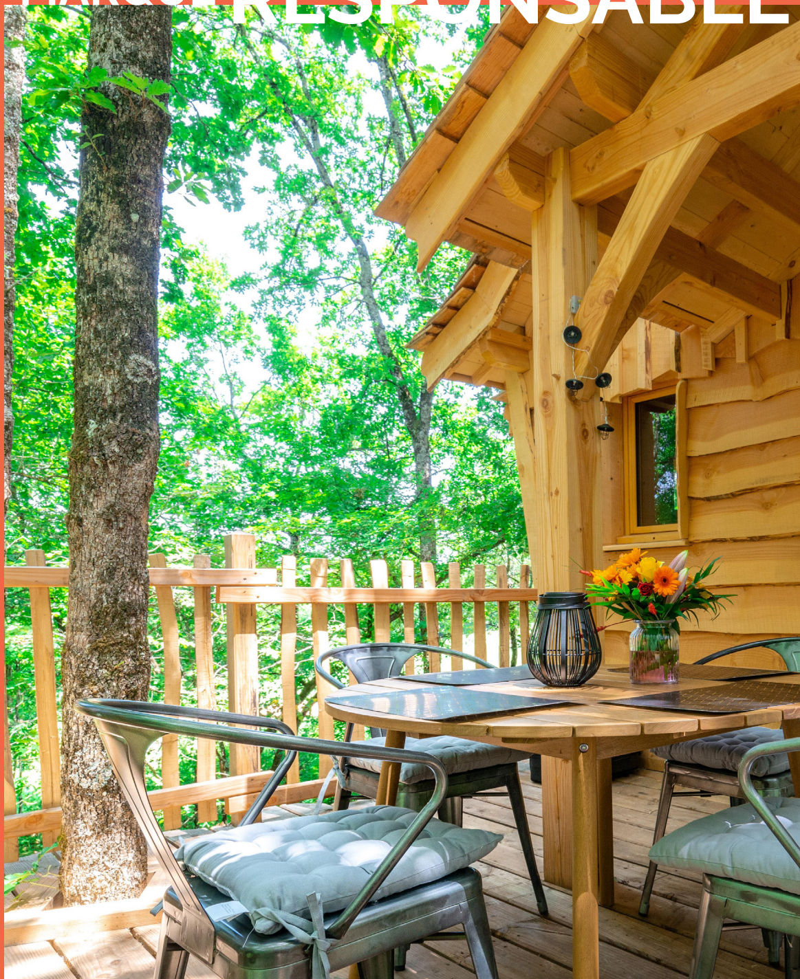
Chambre d'hôtes "Le Domaine Roccas" Lot-et-Garonne